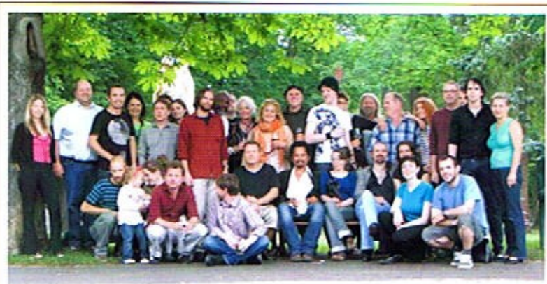
Einige unserer Native Speaker Teachers bei der Abschlussfeier 2009